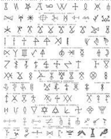
მასონური სიმბოლოთა ანბანი